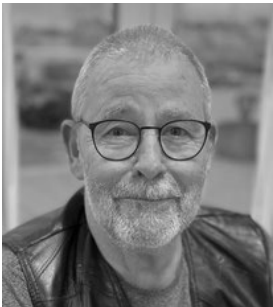
Steen Købsted Formand – På valg

Medlemmerne vælges for en periode på 2 år med forskudte valg. Suppleanter vælges hvert år. Her er den nuværende afdelingsbestyrelse, og hvem der er på valg.